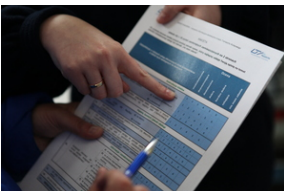
Pomoc przy wypełnianiu ankiety