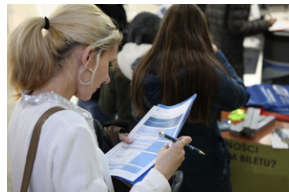
Podczas wypełniania ankiety