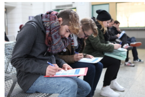
Podróżni wypełniają ankiety