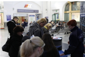
Dzień Pasażera cieszył się dużym zainteresowaniem

Wyniki ankiet znajdują się w załączniku.