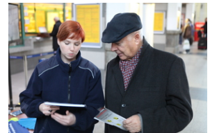
Pytania dotyczące ankiety