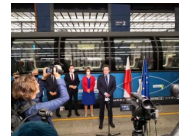
Andrzej Bittel, Sekretarz Stanu w Ministerstwie Infrastruktury