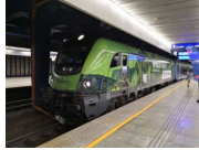
Lokomotywa PKP Intercity z oklejeniem dedykowanym obchodom Roku Kolei