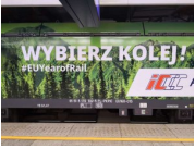
Okolicznościowe oklejenie lokomotywy Griffin EU160-015