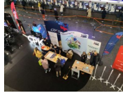
Stoisko Rzecznika Praw Pasażera Kolei, Kampanii Kolejowe ABC oraz UTK z przyrządami pomiarowymi