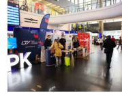
Stoisko informacyjne Rzecznika Praw Pasażera Kolei w holu głównym dworca Warszawa Centralna