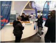
Stoisko informacyjne Urzędu Transportu Kolejowego w holu głównym dworca Warszawa Centralna