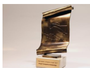
UTK - Przyjazny Urząd