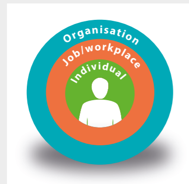
Człowiek jest w centrum systemu społeczno-technologicznego.